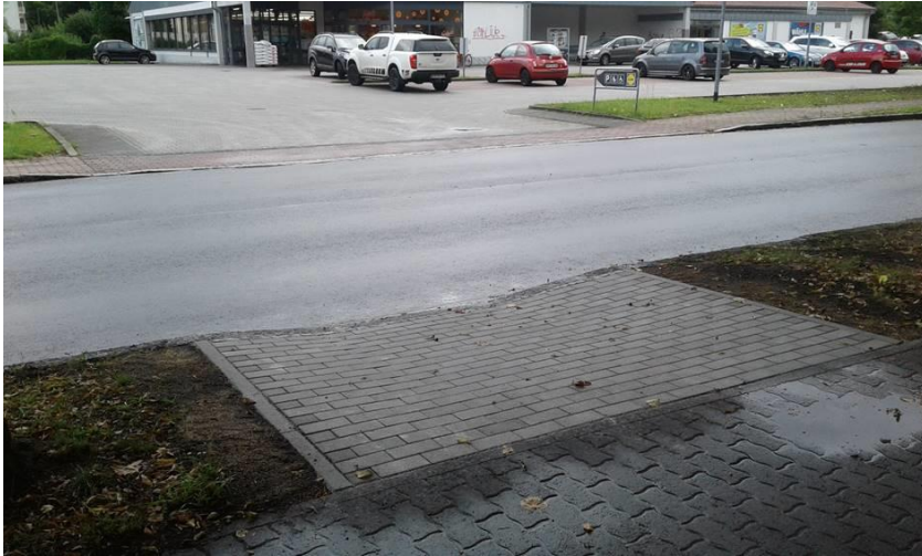
Erhalt der Mobilität Seite 11 – Spruckerstraße Höhe Lidl- Parkplatz