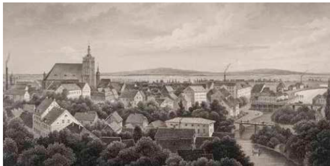
Guben um 1850/56 - Stahlstich von Johann Poppel & Georg Michael Kurz nach Zeichnung von Julius Gottheil

790 Jahre Stadtrecht Guben: ein stolzer Meilenstein in unserer Stadtgeschichte. Die Verleihung des Stadtrechts erfolgte am 1. Juni 1235 durch Heinrich III.,