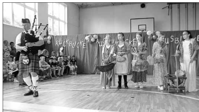
Ausschnitte aus dem Mittelalterfest vergangener Jahre waren zu sehen.