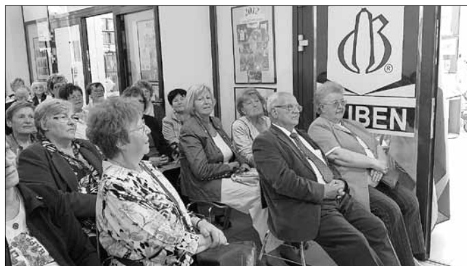
6. Traditionstreffen der ehemaligen Mitarbeiter der Poliklinik zu Besuch in den Ausstellungen der „Gubener Tuche und des ehemaligen Chemiefaserwerkes

Friedrich-Wilke-Platz, Gebäude C Gasstraße 4, 03172 Guben Tel. 03561 5595107