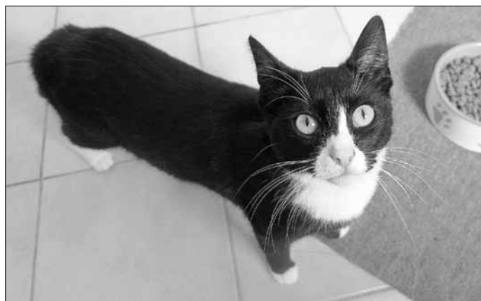
Junge Kätzchen wünschen sich ein liebevolles Zuhause.