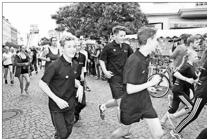
87 Läufer beteiligten sich am Sponsorenlauf des Fördervereins vom Pestalozzi-Gymnasium.

Auch in diesem Jahr hat der Förderverein des Pestalozzi-Gymnasiums Schüler, Lehrer und Freunde des Hauses zum Sponsorenlauf rund ums Dreieck gebeten. Jeder, der sich anmelden wollte, musste sich