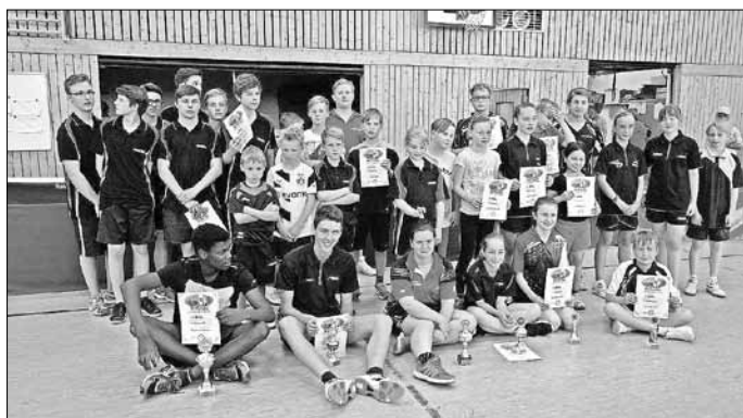
Die Gewinner und Teilnehmer des Nachwuchsturniers