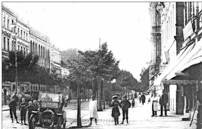
1914 war ein Auto in der heutigen Berliner Straße noch kein alltäglicher Anblick. Auch aus dieser Zeit berichtet das Buch von Gerhard Gunia.

Behandelt werden u. a. die beiden Weltkriege, der Wiederaufbau, die Beziehungen zu Gubin und im zweiten Teil die Geschichte ausgewählter Straßen.