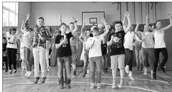
Beim Eröffnungslied „Ein Hoch auf uns“ hatten die Kinder viel Spaß

Nach dem Programm standen den Besuchern dann jede Menge Beschäftigungsmöglichkeiten auf dem Schulhof zur Verfügung. Eine Ballonshow, Kinderschminken, Kutschfahrten, Hau den Lukas und eine Kegelbahn kamen bei den Kindern gut an. Und natürlich war auch für das leibliche Wohl gesorgt. Utr1