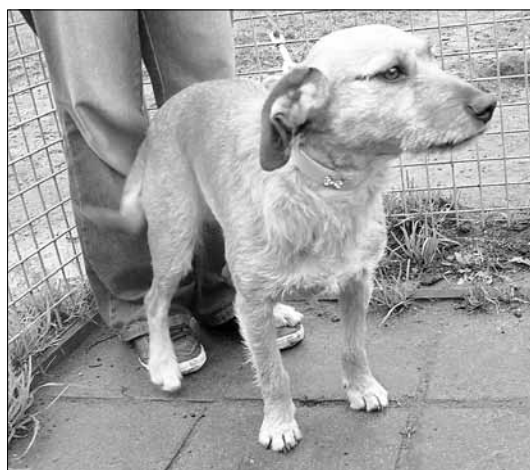
Lisa, Hündin, ca. 4 Jahre alt, anfangs etwas schüchtern, dann jedoch temperamentvoll, sollte beschäftigt werden, sehr liebes Wesen, möchte immer dabei sein; klettert über Zäune.