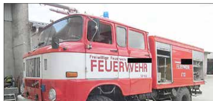
LKW IFA W50.

Die Gemeinde Schenkendöbern beabsichtigt den Verkauf eines LKW IFA W50. Es handelt sich um ein Tanklöschfahrzeug TLF 16/22.