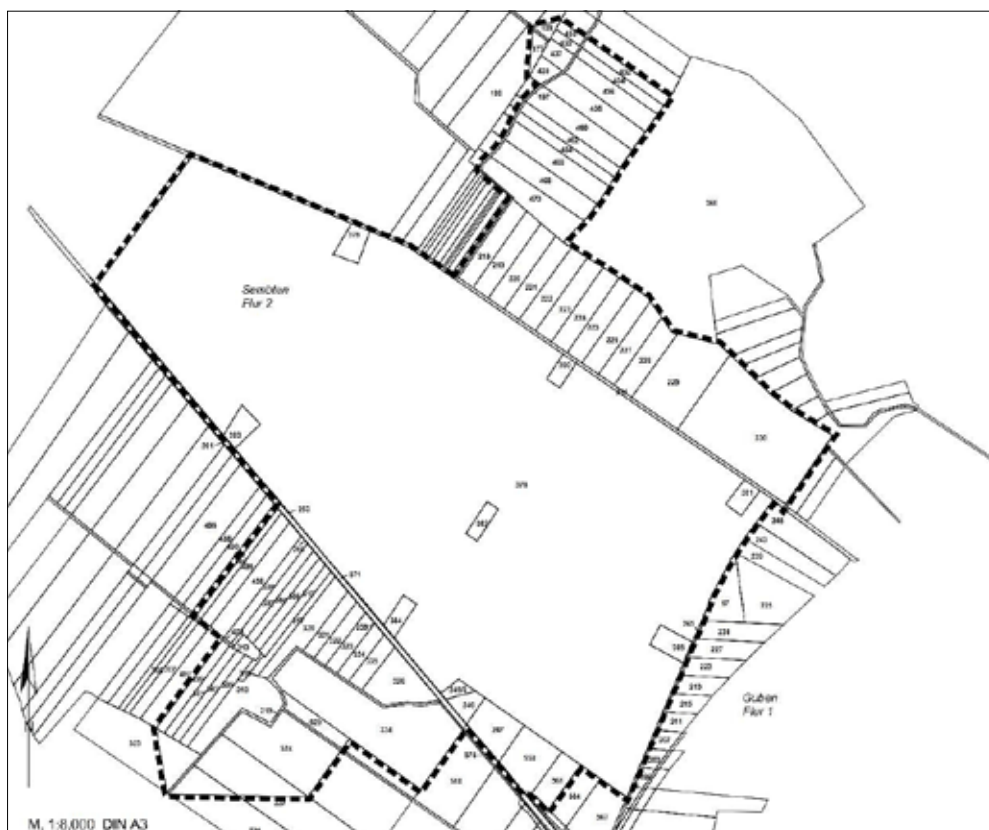
Lageplan (ohne Maßstab)