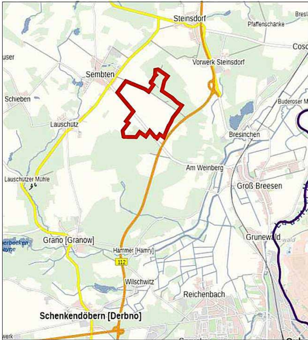
Übersichtsplan (ohne Maßstab)