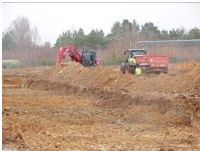
Die ersten Bauarbeiten für den Lithiumhydroxid-Konverter haben begonnen.

Der erste Teilantrag für Rock Techs Lithiumkonverter wurde durch die zuständige Genehmigungsverfahrensstelle Süd des brandenburgischen Landesamtes für Umwelt genehmigt. Die Mitteilung folgt den im Dezember 2022 und Januar 2023 erteilten Zulassungen zum vorzeitigen Beginn des Projekts. Den Antrag hatte das Unternehmen im Februar 2022 eingereicht. Die