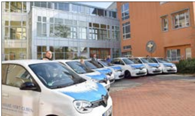
Umweltfreundlich unterwegs mit sieben nagelneuen Elektro-Flitzern.

Die Schwestern der Diakonie Sozialstation sind jetzt mit flotten kleinen Elektro-Flitzern unterwegs. Mit der Anschaffung von sie-