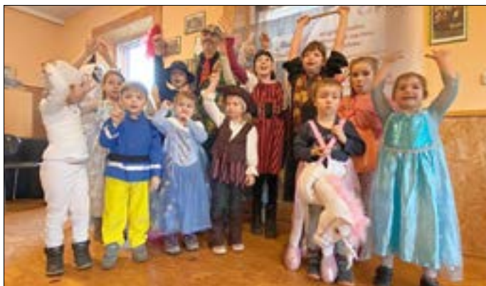
Sichtlichen Spaß hatten die Kinder am 26. Februar 2023 beim Faschingsfest mit Clown Olli.

Seit fast 18 Jahren betreibt die PROKON Regenerative eG den Windpark Sembten mit acht Anlagen in der Gemeinde Schenkendöbern. Im August 2019 wurde er mit dem Projekt Sembten II noch einmal um vier Anlagen im Windpark Sembten II erweitert. Als größte Energiegenossenschaft Deutschlands steht für die Prokon eG eine bürgernahe Energiewende unter dem Motto „Energie.Gemeinsam.Leben.“ im Mittelpunkt. Nach dem Windparkbau bleibt Prokon deshalb vor Ort aktiv. Die Prokon eG kooperiert mit der Gemeinde Schenkendöbern bereits seit mehreren Jahren in verschiedenen Bereichen.