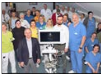
Auftaktsschulung für die Telemedizin.

In der vergangenen Woche haben sich rund 50 Mitarbeiter des Naëmi-Wilke-Stiftes mit den praktischen Möglichkeiten der Telemedizin befasst. Die Firmenvertreter führten Geräte und Anwendungen vor und erste Schulungen durch. Das Naëmi-Wilke-Stift plant den Start der telemedizinischen Versorgung schon in diesem Monat, Ende des Jahres soll die Anwendung so selbstverständlich sein wie ein Telefonat.