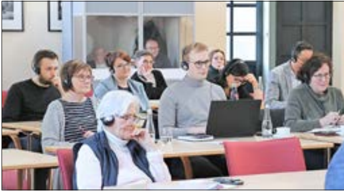
Teilnehmer des dt.-poln. Workshops.

Die Städte Guben und Gubin legten einen Grundstein für ein gemeinsames grenzüberschreitendes Tourismusentwicklungskonzept. Dazu fand am 2. März 2023 in der Alten Färberei ein deutsch-polnischer Workshop mit Vertretern beider Stadtver-