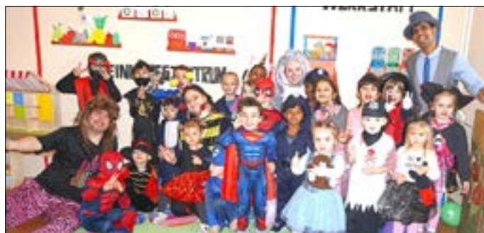
Zur Faschingsfeier waren alle in bunten Kostümen gekommen.

Helau, ihr lieben Kinder, hieß es Mitte Februar im Children Center „Bunte Vielfalt“. Zur Faschingsfeier konnten wir viele Superhelden, Ninjas, Prinzen und Prinzessinnen, Einhörner, Piraten, Polizisten und vieles mehr begrüßen. Bei einem abwechslungsreichen Programm mit buntem Büfett ging es stimmungsvoll zu, mit viel Freude und Spaß an der Sache. Zum Tagesende waren Kinder, Erzieher und Erzieherinnen von den vielen lustigen und bewegungsreichen Spielen sichtlich erschöpft.