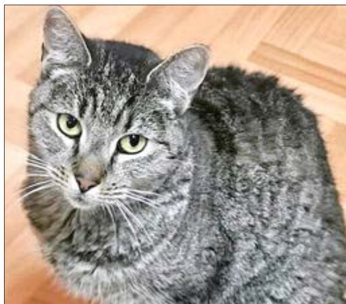
Katze Ruby sucht ein kuschliges Plätzchen auf Ihrer Couch.

Katze Ruby ist ca. 4 Jahre alt, anfangs etwas zurückhaltend, aber mit etwas Einfühlungsvermögen taut sie sehr schnell auf. Dann sucht sie gern die Nähe zum Menschen und fordert sich ihre Streicheleinheiten ein. Mit ihren Artgenossen versteht sie sich blendend und ist daher auch als Zweitkatze bestens geeignet. Gern wird sie auch mit einem weiteren Spielkameraden aus dem Tierheim vermittelt.