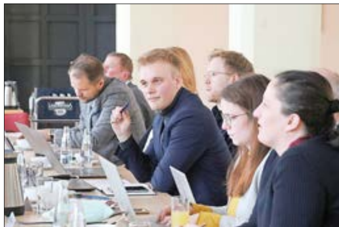
1. Sitzung des Lenkungskreises.

Guben soll eine Smart City - also eine intelligente und clevere Stadt werden. Was das bedeutet und wie das Projekt vorangeht, darüber informiert sie in jeder Ausgabe das Smart City-Team.