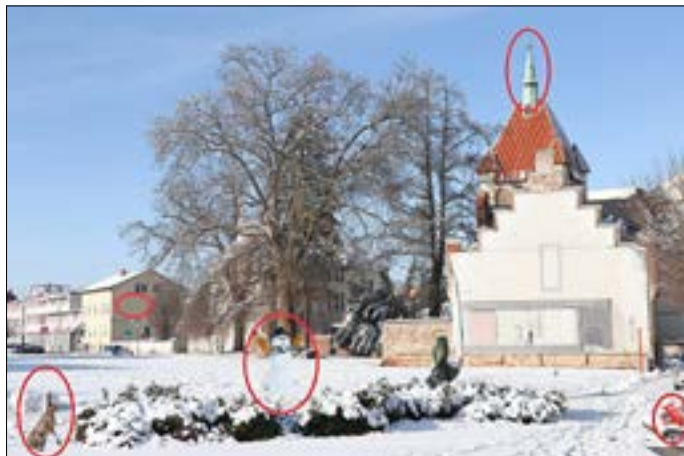
Lösungsbild der letzten Ausgabe.

Die Gewinnerin der letzten Ausgabe ist Holly aus Guben. Der Guben-Gutschein im Wert von 20 Euro wird Dir per Post zugeschickt. Herzlichen Glückwunsch!