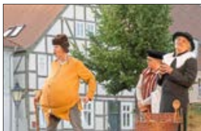
Die Stadt als Bühne - Gesang und Spiel in bester Kulisse und entspannter Atmosphäre.

Die Stadt Guben präsentiert erstmalig das theater 89. Im Rahmen der Sommertournee wird das Theaterensemble am 6. Mai 2023 auf dem Gubener Kirchplatz zu Gast sein. Im Mai 1989 gründete sich das professionelle freie Theater. Gefördert vom Land Brandenburg folgt es einem Konzept der