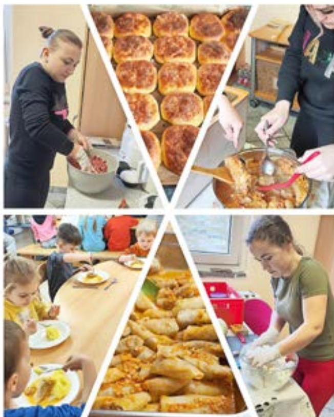
Kochen verbindet - Children Center „Bunte Vielfalt“.

Am 22. Februar 2023, wurde im Rahmen des Programms des Landkreises Spree-Neiße „Kiez-Kita-Bildungschancen eröffnen“, mit ukrainischen Müttern Essen für die Kita-Kinder des Children Centers „Bunte Vielfalt“ gekocht. So wurden auf ukrainische Art, Krautrouladen, Pfannkuchen und Getränke aus getrocknetem Obst hergestellt. Der erste Teil dieses Projekts im Rahmen des Programms „Kiez-Kita“ erfolgte schon im letzten Jahr, bei dem arabische Eltern für die Kinder die Mittagsmahlzeit und das Vesper zubereiteten. Ganz nach dem Motto, Kochen verbindet. Ziel ist es, die Eltern aktiv einzubinden, Vorurteile abzubauen und natürlich einen guten Zugang zu den verschiedenen Nationalitäten zu bekommen.