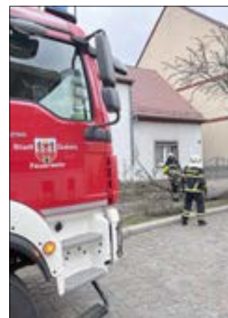
Die Einsatzkräfte sicherten die Einsatzstelle, zerkleinerten den abgebrochenen Ast und beräumten den Gehweg.