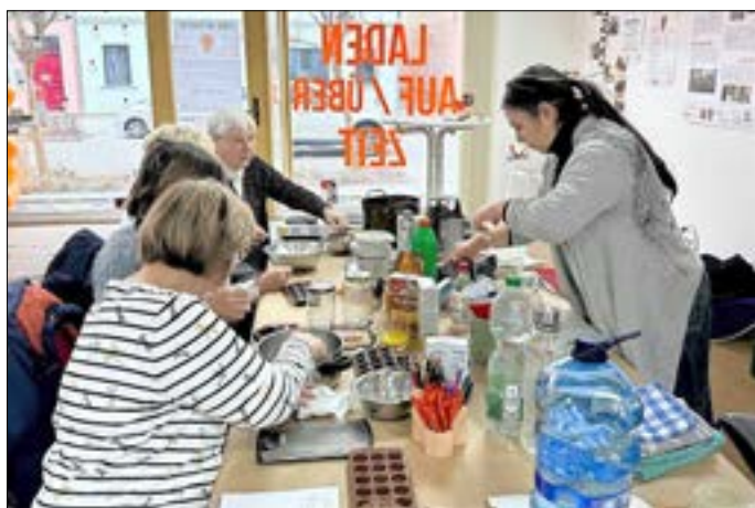
Herstellung von natürlichen Reinigungsmitteln.

Im Februar widmeten wir uns dem Teilprojekt „Laden auf/über Zeit“, dabei entstand im Rahmen unseres Projektes eine Art temporäre Ausstellung. Unser Team organisierte in der Frankfurter Str. 22 eine Vorstellung der bisherigen Aktivitäten gemeinsam mit unserem Projektpartner der BTU. Auch das CreativeOpen-