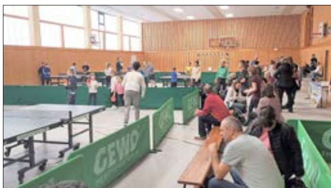
Der Preis für die Schule mit den meisten Startern ging an die Gubener Friedensschule.