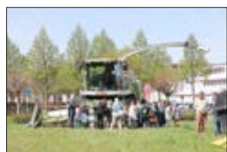
Ausstellung moderner Landtechnik.

Am 4. Mai 2023 lud der Kreisbauernverband Spree-Neiße Groß und Klein zur Auftaktveranstaltung der landwirtschaftlichen Sommertour auf dem Gubener Dreieck ein. Es gab Informationen rund um die Themen Milchwirtschaft, Pflanzenbau und Ausbildung in der Landwirtschaft.