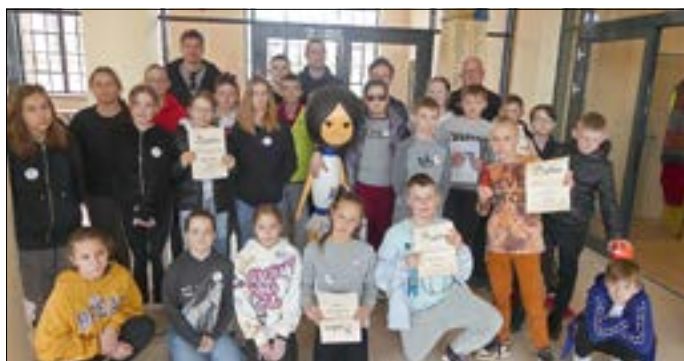
Die Teilnehmenden der Museumsrallye.

Der Verein Gubener Tuche und Chemiefasern möchte auch in diesem Schuljahr mit den Schülern der Gubener Grundschulen die jahrelange Tradition weiterführen und lud zur Museumsrallye ein. Den Anfang machten die 5. Klassen der Gubener