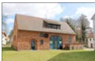
Museumsscheune der Sprucker Mühle.

Traditionell am Pfingstmontag, 29. Mai 2023 , öffnen bundesweit mehr als 1.000 historische Mühlen ihre Türen. Die Deutsche Gesellschaft für Mühlenkunde und Mühlenerhaltung (DGM) e. V. und ihre Landes- und Regionalverbände laden zum Deutschen Mühlentag ein. An diesem besonderen Tag lassen