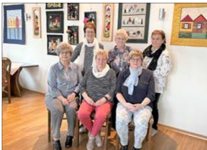
Eine kleine Gruppe der „NeiBestichlinge“.