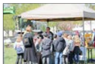
Das Gut Neu Sacro präsentierte Angebote aus dem eigenen Hofladen.