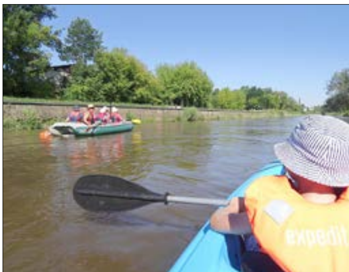
Paddelspaß auf der Neiße.

Die beliebteste Tour von Guben nach Ratzdorf bietet der Marketing und Tourismus e. V. auch in diesem Jahr wieder an. Die