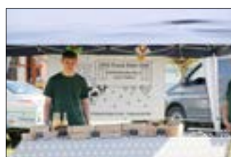
Eiermanufaktur & Hühnermobil Bähr aus Reichenbach.