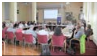
Teilnehmende des Workshops „Stadt- und Industriemuseum Guben - quo vadis?“

Die Region ist im Wandel. Die Kulturakteure aus Brandenburg und Sachsen haben mit dem Kulturplan Lausitz eine langfristige Strategie sowie konkrete Projektvorschläge für die weitere Strukturentwicklung in der Lausitz vorgelegt. Das Ziel: Kunst und Kultur sollen als produktive Kraft und integrale Bestandteile des Strukturwandels etabliert werden. Dieser Herausforderung will sich auch die Stadt Guben in Kooperation mit Gubin und weiteren Akteuren stellen.