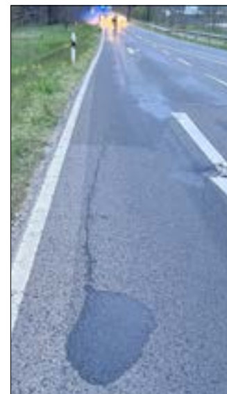
Ölspur auf der Cottbuser Straße.