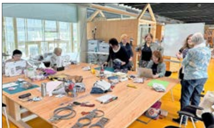
Nähen verschafft einzigartige Unikate.

Das Projekt „Altersinnovationen“ organisierte Ende April 2023 einen Nähworkshop und zeigte dabei, wie aus alten Stoffen neue Dinge entstehen können. Davon konnten sich die Teilnehmerinnen des Nähworkshops im CreativeOpenLab (COLab) selbst überzeugen. Dabei ergab sich eine schöne Gelegenheit mit den Workshopleiterinnen die Fähigkeiten im Nähen zu vertiefen. Unter fachkundiger Anleitung konnten alle ihr Können testen. Dabei nutzten sie die hochwertigen Stickmaschinen vor Ort. Die Gruppe stellte u. a. Wäscherfrischer und Stoffkörbchen in den verschiedensten Varianten her. Der Ausflug ins Cottbuser COLab kam bei allen Teilnehmenden sehr gut an. Alle waren von dem Angebot begeistert und freuten sich auf weitere Aktionen des Projektteams.