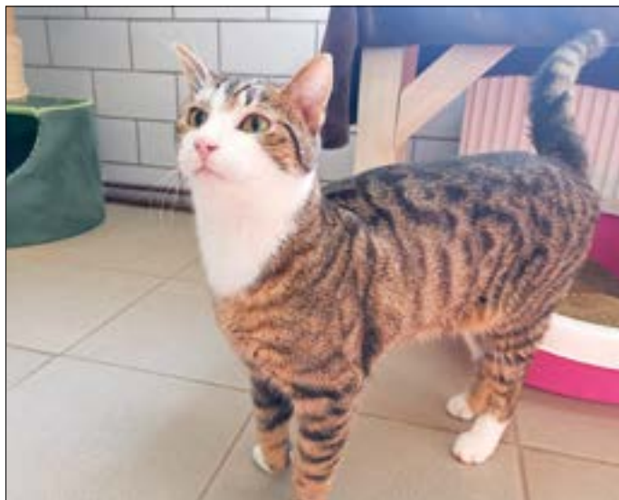
Kater Winnie sucht ein neues Zuhause!

Das Tier des Monats Mai ist Kater Winnie. Der einjährige Fundkater versteht sich blendend mit seinen Artgenossen und möchte unbedingt einen Spielgefährten in seinem neuen Zuhause. Er ist seinem Alter entsprechend verspielt und aufgeschlossen. Aber auch zu Streicheleinheiten sagt er nicht nein, quasi ein absolut zutraulicher Kuschelkater. Winnie ist sehr vertrauensvoll und wird sich daher schnell in seinem neuen Zuhause einleben. Er ist geimpft, gechippt und kastriert.