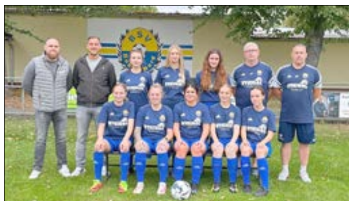
Frauenfußballmannschaft. © Richter

Der BSV Guben Nord hat seit März 2023 eine Frauenfußballmannschaft. Dafür werden noch Mädchen und Frauen ab 14 Jahren gesucht. Trainiert wird immer Montag und Mittwoch von 18:30 bis 20:00 Uhr. Interessenten können sich gern unter bsvguben34@gmail.com melden oder einfach beim Training auf dem Sportplatz an der Baumschule in Groß Breesen vorbeischauen.