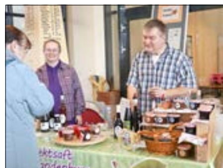
Das Land- und Forstwirtschaftsunternehmen aus Kunersdorf bot alles aus dem Bereich Strauchbeerenobst.