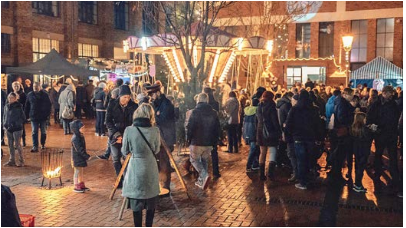
Original. © Mateusz Turowski

Finden Sie alle Fehler und gewinnen Sie einen Guben-Gutschein im Wert von 20 Euro. Senden Sie die korrekte Fehleranzahl mit Ihrem Namen und Ihrer Anschrift bis zum 1. Dezember 2023 per E-Mail an lehmann.l@guben.de oder werfen Sie das Rätsel mit den Fehlern gekennzeichnet in den Briefkasten der Stadtverwaltung Guben. Der oder die Gewinner/in wird in der nächsten Ausgabe am 15. Dezember 2023 bekanntgegeben. Der Rechtsweg ist ausgeschlossen. Leerzeichen bleiben unbeachtet.