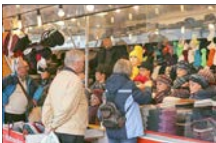
Passend zur kalten Jahreszeit zeigten die Zerber Hutmoden ihr breites Sortiment.