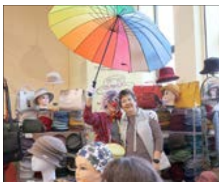
Die Gub Hut GbR ist von Anfang an bei der Produktmesse vertreten.

Termine in 2024 16. März 2024 9. November 2024