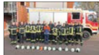
Gut Wehr an alle neuen Kameraden!

Am 11. November 2023 hatten die Prüflinge des Grundlehrganges um 11:11 Uhr ihre praktische Abschlussübung bereits absolviert. Davor galt es in der schriftlichen Prüfung das erlernte Wissen anzuwenden. Wir gratulieren den Teilnehmern und freuen uns über das große Interesse am Ehrenamt. Habt auch ihr Lust mitzumachen? Dann meldet euch einfach!