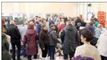
Zahlreiche Besucher nutzten die Angebote.

Seit 2014 veranstaltet die Stadt Guben zweimal jährlich die Produktmesse. Alles getreu dem Motto aus unserer Region für unsere Region. Dabei steht das Thema Nachhaltigkeit an oberster Stelle, kurze Transportwege benötigen meist auch weniger Verpackung. Der Zuspruch der Anbieter und vor allem die zahlreichen Besucher machen deutlich, dass das Angebot der hochwertigen Produkte geschätzt wird. Passend zum 11. November besuchte ab 11:11 Uhr ein Clown die Gubener Produktmesse und verteilte Süßes.