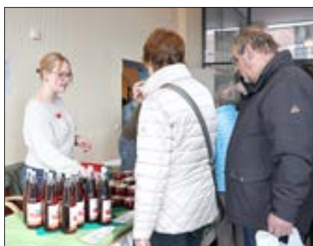
Obstbau Aldag präsentierte die Vielfalt der Königin der Beeren.