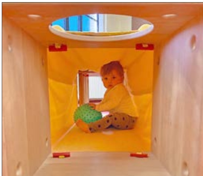
Hier gibt es viel zu entdecken.

Unseren Spielraum für die allerjüngsten genießen bereits einige kleine Musikschüler. Ein ungestörtes und freies Spiel in sorgfältig vorbereiteter Umgebung. Für die Eltern heißt es: „Zuschauen & Staunen“ – dem Kind ohne Erwartungen, Druck und Vergleiche, in abwartender Haltung begegnen und sich gemeinsam erfreuen am Tun des Kindes aus eigenem Antrieb. Der Spielraum ist ein geschützter Ort für alle Kinder ab 6 Monaten. Entwickeln und stärken Sie Vertrauen in die von der Natur gegebenen Fähigkeiten der Kleinsten und entdecken Sie diese mit pädagogischer Begleitung. Unser Angebot, angelehnt an den Pikler-Spielraum, stellt eine gute Vorbereitung für die Kinder und deren Eltern auf das Fach Musikalische Früherziehung (MFE) dar. Während später in der MFE bereits erste Erfahrungen mit Instrumenten gemacht werden, geht es in diesem Angebot lediglich um das lustvolle, freie Spielen mit altersgerecht ausgewählten Spielmaterialien, Alltagsgegenständen und/oder Naturmaterialien. Die Stärkung der Eltern-Kind-Beziehung steht im Mittelpunkt. Der Kurs findet immer samstags (außer in der schulfreien Zeit) um 10:00 Uhr statt. Kursleiterin ist Michaela Zach.