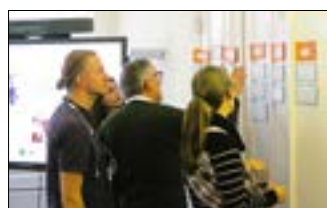
Austausch im Bürgerbeirat.

Das von unserer Euroregion, dem Landkreis Spree-Neiße, dem Landkreis Krośniewski sowie dem Naëmi-Wilke-Stift, als assoziierten Partner, initiierte. Ziel ist es, Bürgerinnen und Bürger in Politik und Verwaltung über die Landesgrenze hinweg bis zum Frühjahr 2025 in den Austausch zu bringen und einen dialogorientierten Prozess zu gestalten.