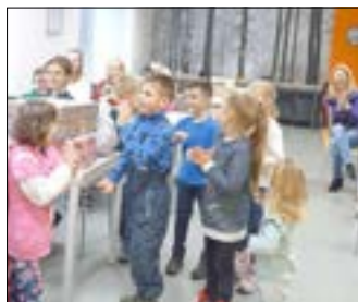
Große Freude bei den Empfängern.

Eine lange Liste mit 464 Namen liegt im Stiftssekretariat vor. Wir sind eingeladen, kleinen und großen Menschen, die in der Diakonie in Schlesien/Tschechien und Polen betreut werden, eine Freude zu machen. Viele von ihnen haben eine körperliche oder geistige Beeinträchtigung und freuen sich wieder auf einen Karton mit einer kleinen Überraschung.