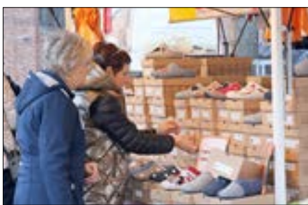
Bequeme Schuhe für empfindliche Füße gab es beim Schuhhaus Karge.