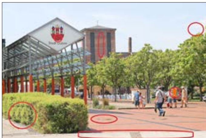
7 Fehler waren im letzten Rätsel versteckt.