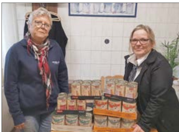
Das Gubener Tierheim bedankte sich für die Spende.