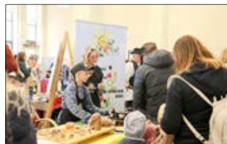
Bei dem Jungen Gemüse der Corona-Schröter-Grundschule gab es u. a. leckere Waffeln.