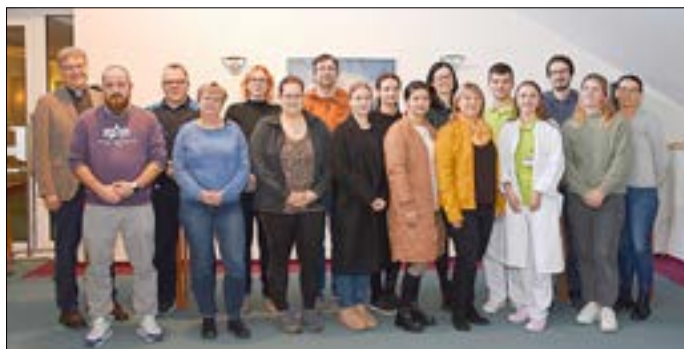
16 von 29 neuen Mitarbeitenden erhielten Einblicke in die verschiedenen Bereiche.

16 neue Mitarbeitende aus verschiedenen Abteilungen des Naëmi-Wilke-Stifts lernten am 13. November 2023, die Stiftung in vielen Facetten kennen. Was bedeutet es, in einem christlichen Haus zu arbeiten? Welche Hygienerichtlinien gelten für alle? Wie wird die Qualität gesichert? Was macht die Mitarbeitervertretung? Dies waren nur einige Themen, die besprochen wurden. Bei einem Rundgang in die Räume der Technik blickten die „Neuen“ auch hinter die Kulissen. Ein gemeinsames Frühstück und Mittagessen mit dem Vorstand des Hauses rundete den Tag ab.