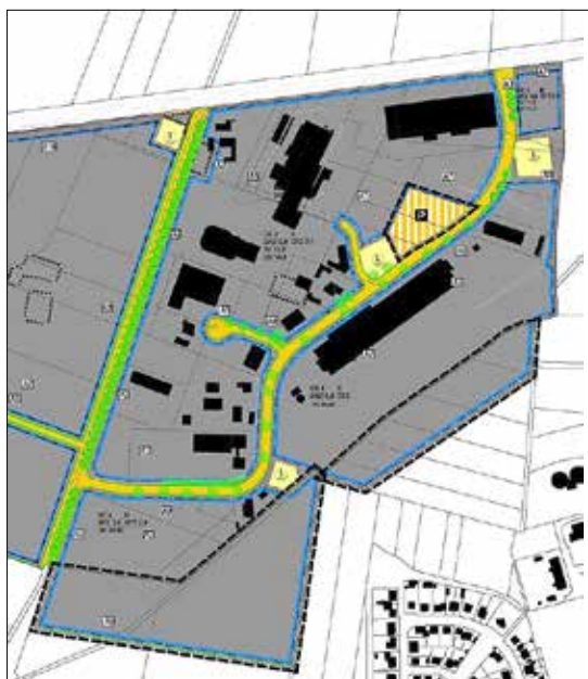
Abb: Geltungsbereich der 5. Änderung des Bebauungsplans Nr. 11 „Gewerbegebiet Guben-Deulowitz“

Der räumliche Geltungsbereich der 5. Änderung des Bebauungsplans Nr. 11 „Gewerbegebiet Guben-Deulowitz“ betrifft zwei Teilflächen südlich und südöstlich des bestehenden Gewerbegebietes im Westen der Stadt Guben. Der Geltungsbereich ist in der nachstehenden Planskizze mit einer dicken, schwarzen gestrichelten Linie dargestellt.