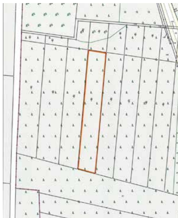
Gemarkung Deulowitz, Flur 5, Flurstück 35/2