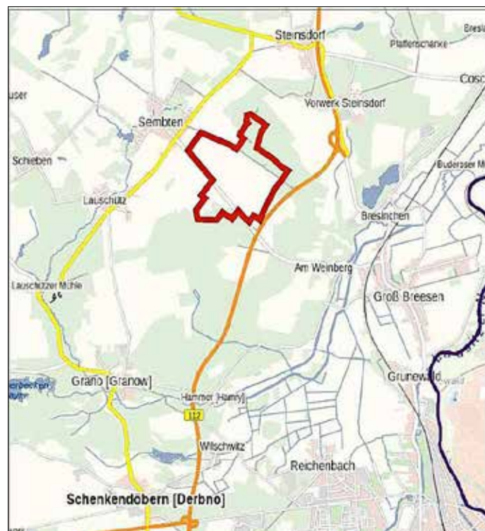
Geltungsbereich des Bebauungsplans Nr. 36 (Übersichtskarte TK25, ohne Maßstab)