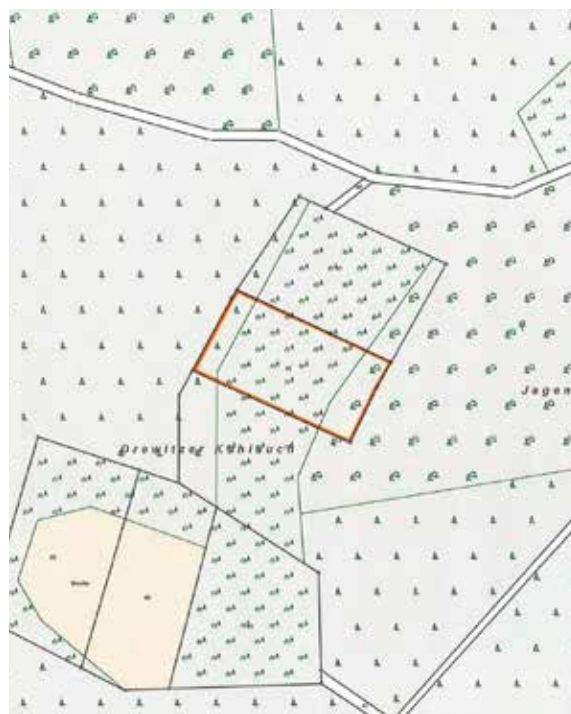
Gemarkung Groß Drewitz, Flur 7, Flurstück 42