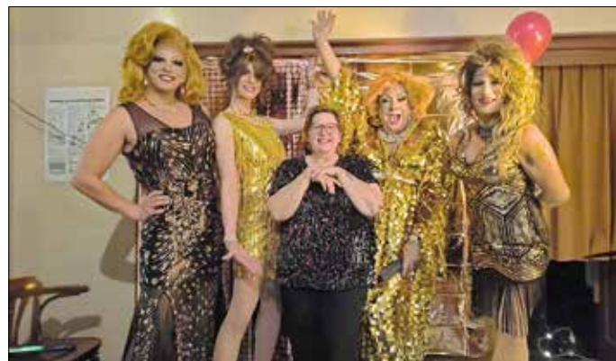
Glanz, Glamour und strahlende Freude.

Zum zweiten Mal organisiert der AWO Ortsverein Guben ein Event in der Friedensgrenze für unsere Bürger.