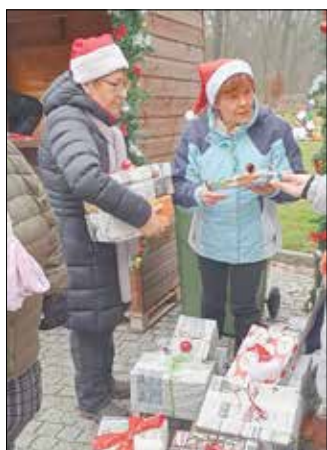
Übergabe der Wichtelpakete.

Am 13. Dezember 2025 fand das nun schon zur Tradition gewordene Adventssingen auf dem festlich geschmückten Schlosshof in Bärenklau statt.