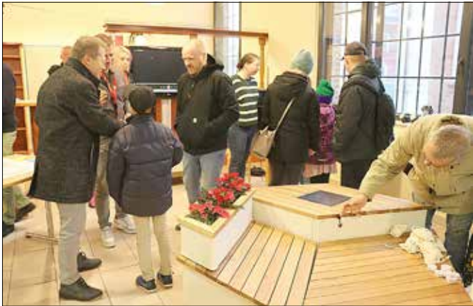
Neue Stadtmöbel verfügen über Solarpaneele zum Aufladen mobiler Geräte.

Zum Gubener Weihnachtsmarkt am 13. Dezember 2025 wurden zum ersten Mal die neuen Stadtmöbel aus dem Smart-City-Projekt präsentiert. Besonderes Highlight war die Gubenwabe – eine moderne Sitzgelegenheit mit integriertem Solarpanel in der Tischfläche.