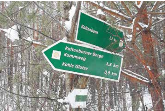
Winterlicher Wegweiser.