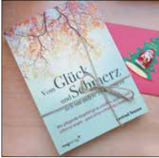
Ein Ratgeber für pflegende Angehörige.

„Pflege vor Ort“ - das erfolgreiche Förderprogramm zur Unterstützung häuslicher Pflege des Landes Brandenburg wurde nach den Landtagswahlen im Mai 2025 weitergeführt. Die Stadt Guben beteiligt sich bereits seit 2022 am Förderprogramm und gibt die Mittel an vier Träger und Wohlfahrtsverbände weiter. Ziel der Förderung ist die Unterstützung von Pflege in der eigenen Häuslichkeit durch die Gestaltung alters-